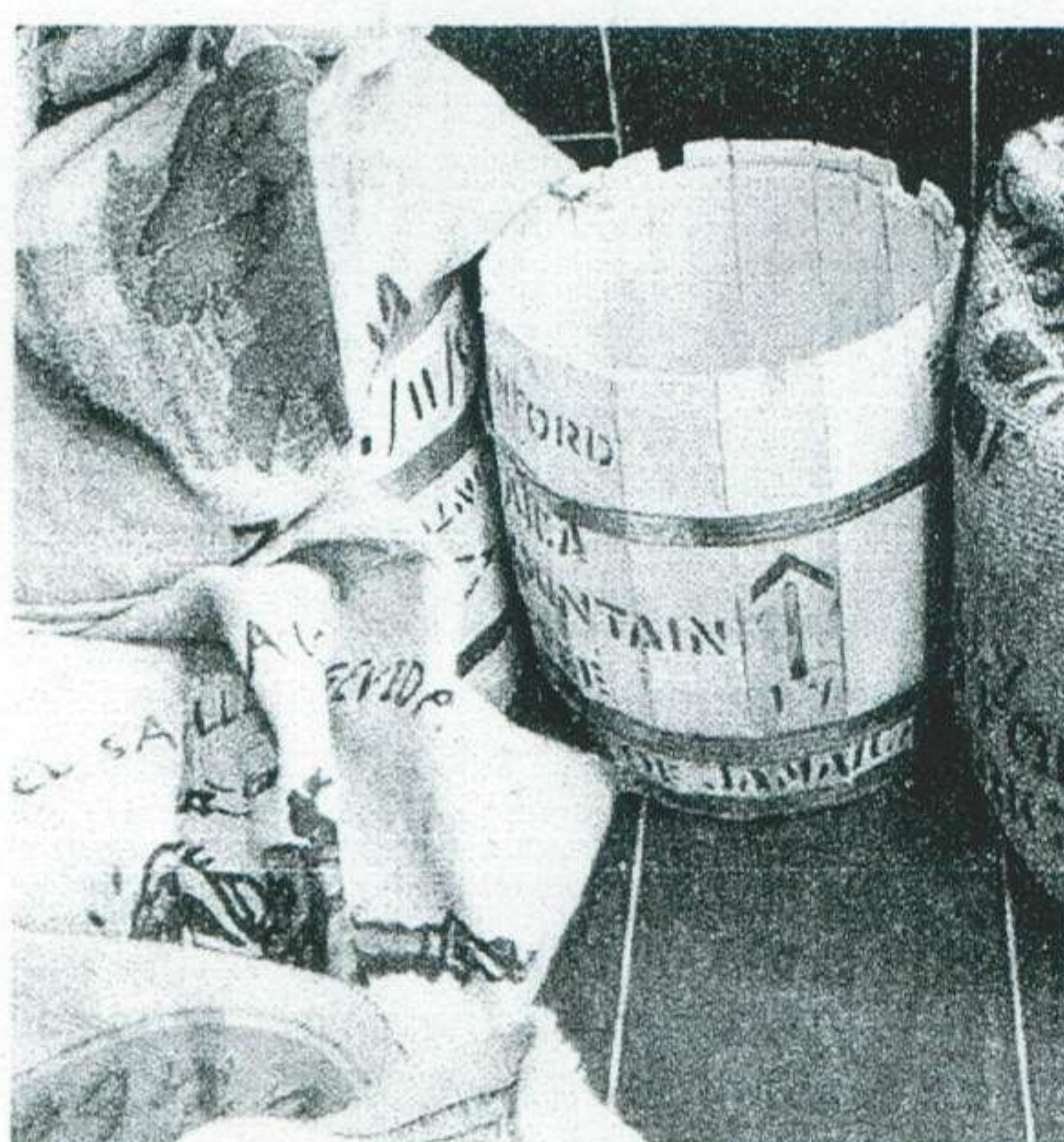
In solchen Säcken wird der Rohkaffee angeliefert.