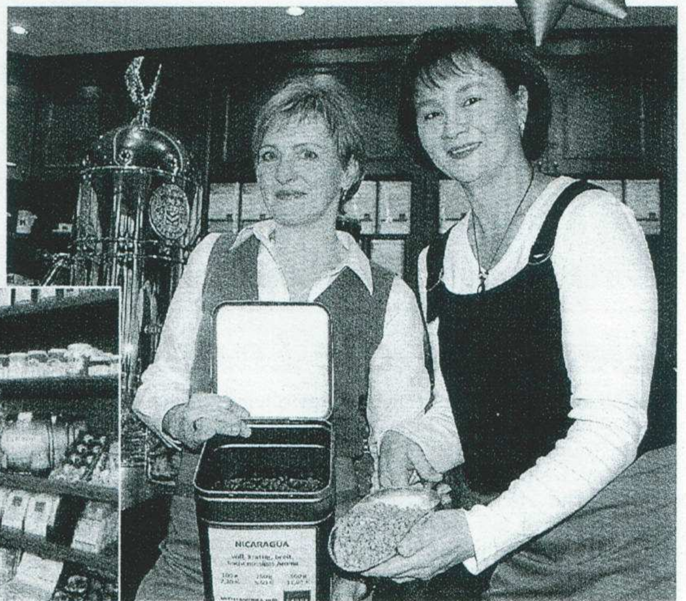
Im GANOS geht nix ohne die Bohne.